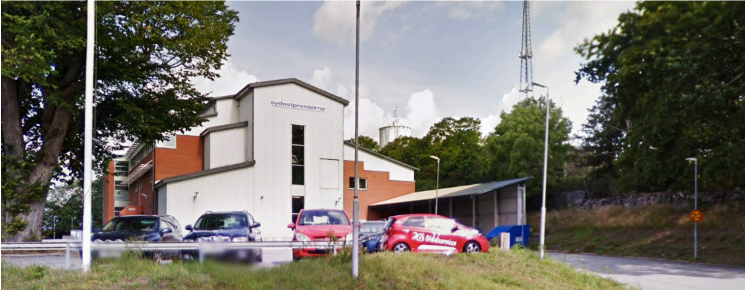
Tryckeriet i Karlskrona.